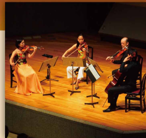
東京都交響楽団メンバー