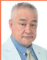
横田滋: 原田大二郎