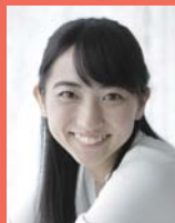
横田めぐみ: 仁科咲姫