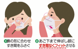
1鼻の形に合わせすき間をふさぐ 2あご下まで伸ばし顔にすき間なくフィットさせる