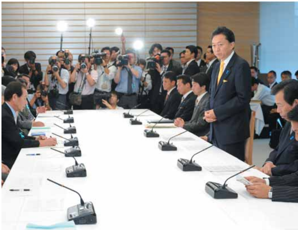
Conversación entre el Primer Ministro Hatoyama y las familias de víctimas secuestradas (Septiembre de 2009)

El Gobierno de Japón sigue exigiendo enérgicamente a la parte norcoreana que efectúe una pronta decisión hacia la resolución del problema aprovechando todas las oportunidades que se presenten, manteniendo la postura de intentar realizar una pronta repatriación de todas las víctimas de los secuestros y aclarar el “desafortunado pasado” para normalizar las relaciones diplomáticas, basándose en la Declaración de Pyongyang.