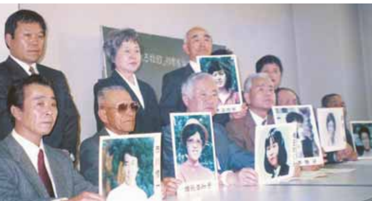
Formación de la Asociación de Familias de Víctimas Secuestradas por Corea del Norte (“Asociación de Familias”)

Se cree que los motivos de los secuestros, acto criminal sin precedentes cometido por el Estado son los siguientes: falsificación de identidad por parte de agentes norcoreanos usando la identidad de los secuestrados japoneses, uso de las víctimas japonesas como instructores para que los agentes se hagan pasar por japoneses y reclutamiento por el grupo “Yodo-go”(*), encubierto por Corea del Norte.