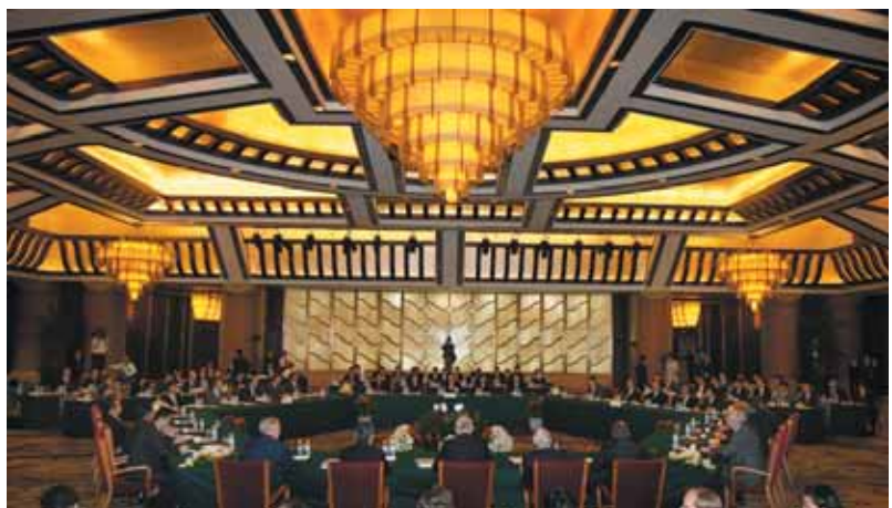
Conversaciones a seis bandas (27 de septiembre de 2007)