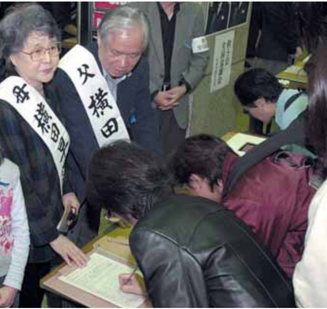
Campaña de recolección de firmas llevada a cabo por la "Asociación de Familias"

El Gobierno del Japón ha identificado a 17 víctimas de secuestro perpetradas por Corea del Norte sin embargo como no se puede descartar que se hayan producido más secuestros, las autoridades mantienen las investigaciones respectivas. Entre los resultados de las indagaciones y consultas, se ha podido determinar que también se registraron secuestros de ciudadanos no japoneses (de nacionalidad norcoreana) residentes en el territorio japonés y otros casos perpetrados en otros países.