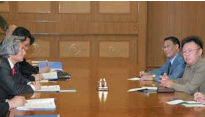
Segunda reunión cumbre entre Japón Y Corea del Norte (22 de mayo de 2004)

Kim Jong-Il sobre una serie de problemas bilaterales, empezando por los de los secuestros, armamento nuclear y los misiles, así como los problemas de garantías de seguridad, entre otros. Con respecto al asunto de los secuestros, ambos dirigentes acordaron los siguientes puntos a través de sus negociaciones en la reunión cumbre.