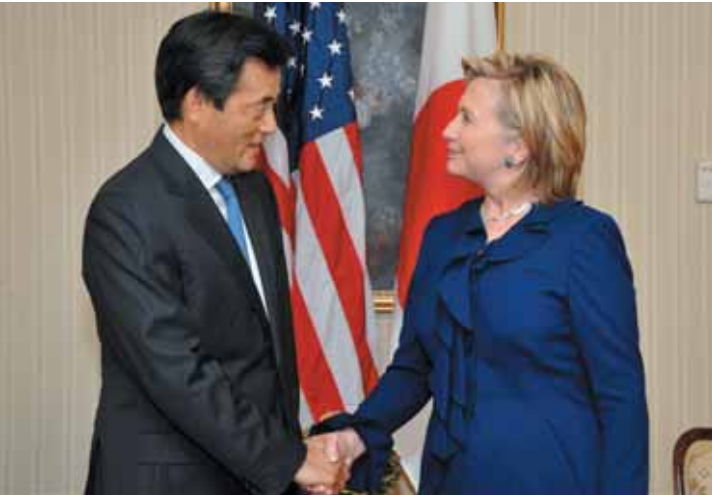
Reunión diplomática entre los Estados Unidos Y Japón (Septiembre de 2009)

Además, en las Reuniones Cumbres bilaterales con Estados Unidos, China, Corea del Sur y los otros países se expresaron la comprensión y el apoyo a la posición japonesa. Por ejemplo, en la reunión de los cancilleres norteamericano y japonés en septiembre de 2009, la Secretaria de Estado norteamericana Hillary Clinton recordó que durante su visita a Japón de febrero de ese año se reunió con los familiares de los secuestrados y aclaró que “el tema de los secuestros supone un acontecimiento triste y me interesa personalmente.” (2) Japón ha venido abordando este tema en la agenda de las Conversación de Seis Partes. En septiembre de 2005, se adoptó una declaración conjunta que instaba la toma de medidas para la normalización de relaciones diplomáticas como uno de los objetivos de la Conversación, teniendo como base la resolución de los asuntos pendientes incluyendo el tema de los secuestros. En el documento final de febrero de 2007,