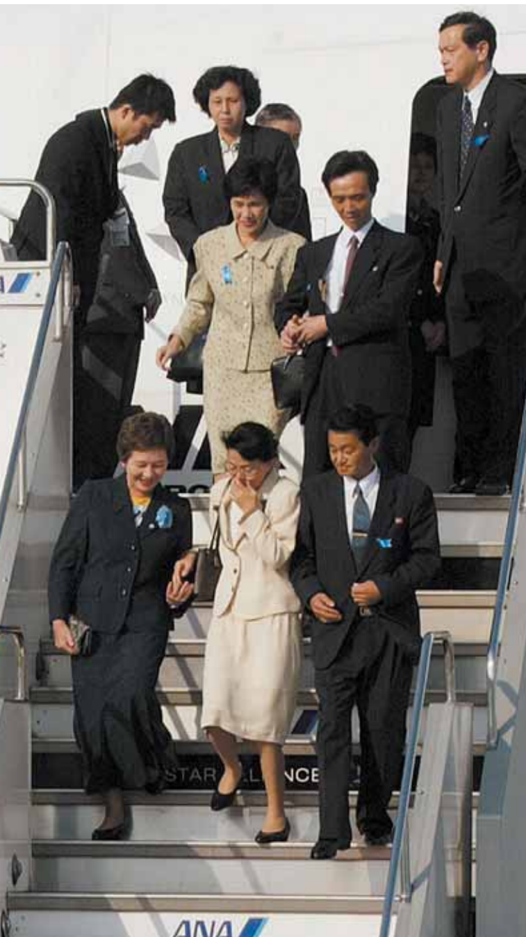
Las víctimas secuestradas regresan a Japón después de 24 años