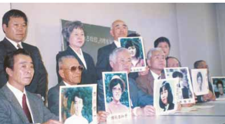
Création de l'Association des familles des victimes des enlèvements par la Corée du Nord (Association des familles)

Durant les années 1970 et 1980, un grand nombre de Japonais ont disparu dans des circonstances anormales. Les enquêtes menées par les autorités japonaises et les témoignages d'agents nord-coréens réfugiés à l'étranger ont permis de déterminer que de nombreuses disparitions étaient probablement dues à des enlèvements commis par la Corée du Nord. Fort de ces découvertes, le gouvernement du Japon, n'a cessé depuis 1991 d'évoquer la question des enlèvements à la Corée du Nord chaque fois que l'occasion lui permettait. Pour sa part, la Corée du Nord a persisté dans ses dénégations jusqu'au 17 septembre 2002 où, lors de la première rencontre au