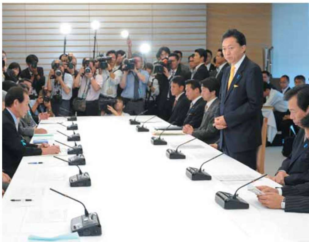
Беседа премьер-министра Хатояма с членами семей похищенных (сентябрь 2009 г.)

Японское правительство, следуя Пхеньнской Декларации, подписанной Японией и КНДР, придерживается последовательной политики, которая заключается в реализации наискорейшего возвращения на Родину всех жертв похищений и нормализации отношений двух стран посредством закрытия вопросов «несчастий прошлого». На основании этой политики, правительство Японии будет использовать все возможности для оказания давления на Северную Корею в целях скорейшего решения проблемы похищений.