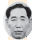
Ким Сэ Хо