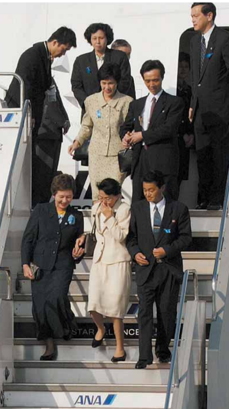
Возвращение на родину жертв похищений спустя 24 года

ее содержание лишено последовательности и в ней содержалось много фактов, вызывавших сомнения. Так, результатами судебно-медицинского исследования было установлено, что представленные «останки», идентифицированные Северной Кореей как «останки» Каору Мацүки, являются останками другого человека. Также и во время 12-го раунда переговоров по нормализации отношений между Японией и Северной Кореей, проходившего 29 и 30 октября того же года в Куала-Лумпуре, несмотря на то, что японская правительственная делегация указала 150 пунктов, вызывающих сомнения, и потребовала представления более детальной информации, никакого внятного ответа от северокорейской стороны получено не было.