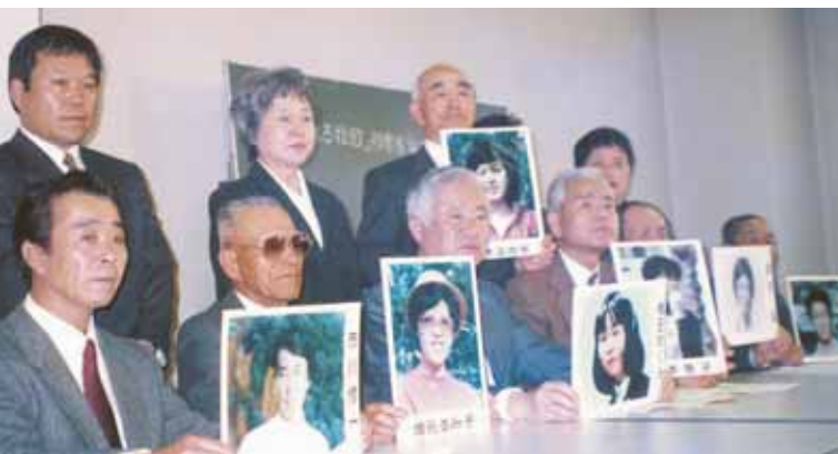
Образована "Ассоциация семей жертв похищений Северной Кореей" (сокр.-"Ассоциация семей")

Однако поскольку нельзя отрицать вероятности и