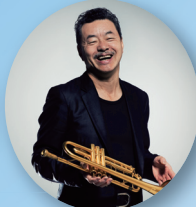
日野皓正クインテット with 渡辺裕之