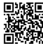
拉致対チャンネル

http://www.city.nagoya.jp/shisei/category/49-3-0-0-0-0-0-0-0-0-0.html