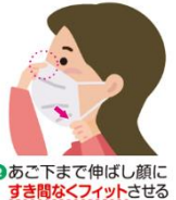
2 あご下まで伸ばし顔に すき間なくフィットさせる