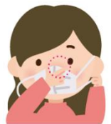
1 鼻の形に合わせ すき間をふさぐ