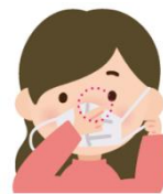
1鼻の形に合わせ すき間をふさぐ