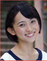
横田めぐみ：仁科咲姫