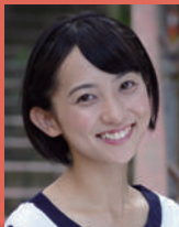
横田めぐみ：仁科咲姫