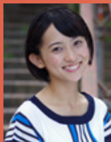
横田めぐみ：仁科咲姫