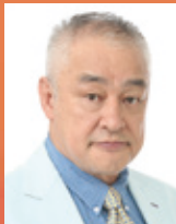
横田 滋：原田大二郎