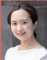
横田 めぐみ：北場子