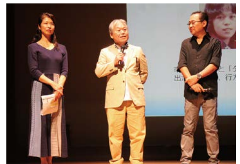
被害者御家族による呼びかけの様子

(※)「特定失踪者」とは、民間団体である「特定失踪者問題調査会」が、「北朝鮮による拉致かもしれない」という御家族の届出等を受けて、独自に調査の対象としている失踪者のこと。