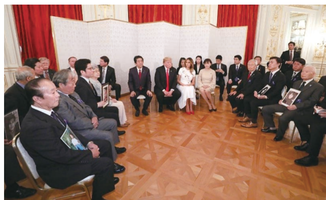
拉致被害者御家族とトランプ米国大統領との面談(2019年)