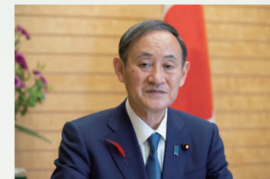
菅 義偉 内閣総理大臣