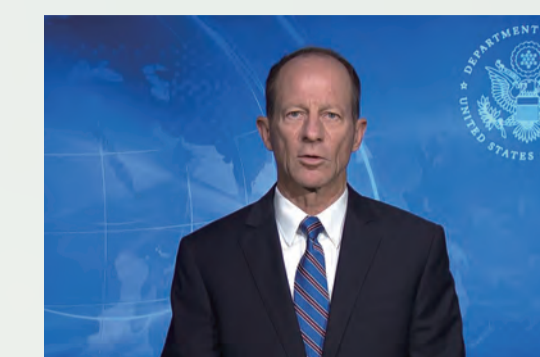
デービッド・ スティルウェル 米国国務次官補 (東アジア・太平洋担当)