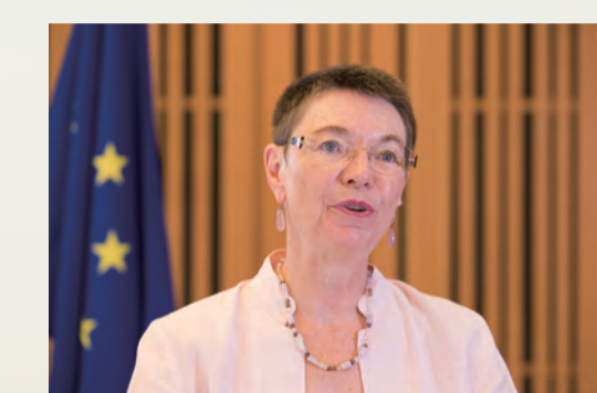
パトリア・ フロア 駐日欧州連合 特命全権大使