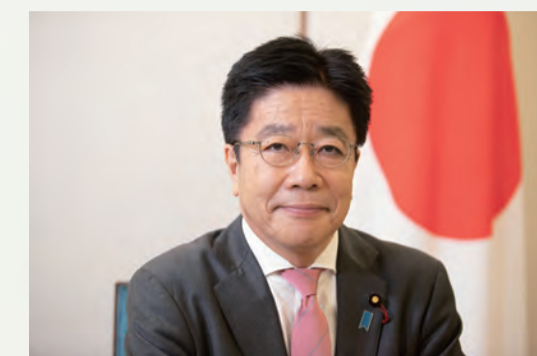
加藤 勝信 内閣官房長官 兼 拉致問題担当大臣