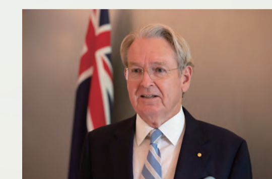
リチャード・ コート 駐日オーストラリア 特命全権大使