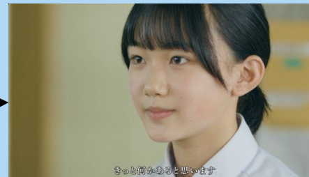
きっと何かあると思います