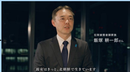
彼女はきっと、北朝鮮で生きています