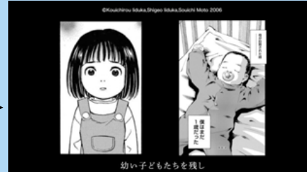
幼い子供たちを残し