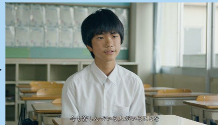
今も苦しんでいる人がいることを