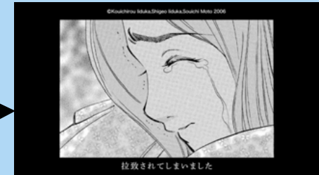
拉致されてしまいました