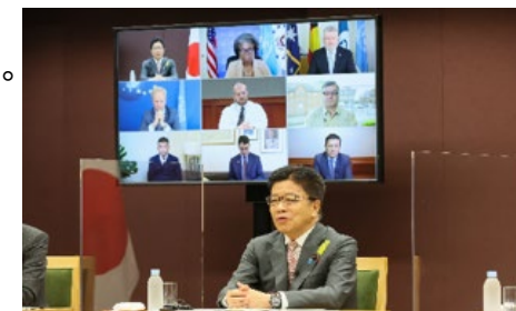
オンライン国連シンポジウム （令和3年6月）